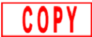
Hình 4. Mẫu dấu “COPY”