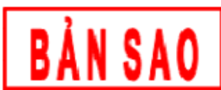
Hình 2. Mẫu dấu “BẢN SAO”

2. Đối với Giấy chứng nhận kiểm dịch động vật, sản phẩm động vật xuất khẩu, nhập khẩu, tạm nhập tái xuất, chuyển cửa khẩu, quá cảnh lãnh thổ Việt Nam: