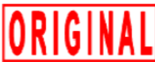
Hình 3. Mẫu dấu “ORIGINAL”